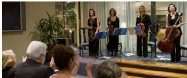
■ El cuarteto de cuerda durante su actuación

Tras este acto, tuvo lugar una cena en el que se sirvió un menú navideño que luego culminaría con un baile donde se pudo disfrutar de la mejor música.